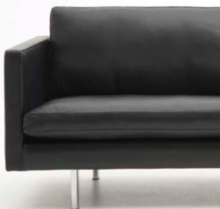
Handy sofa fra Nielaus

20% på Jensen madrasser 10% på nattbord og gavler