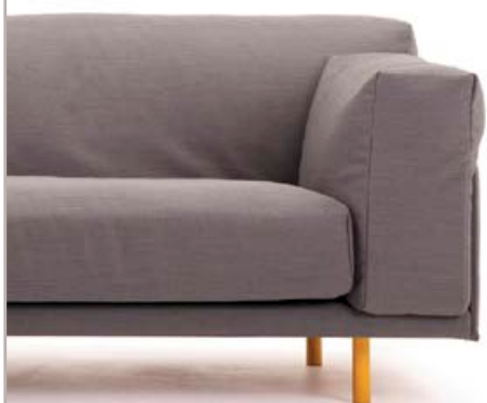
Ted sofa fra L.K. Hjelle